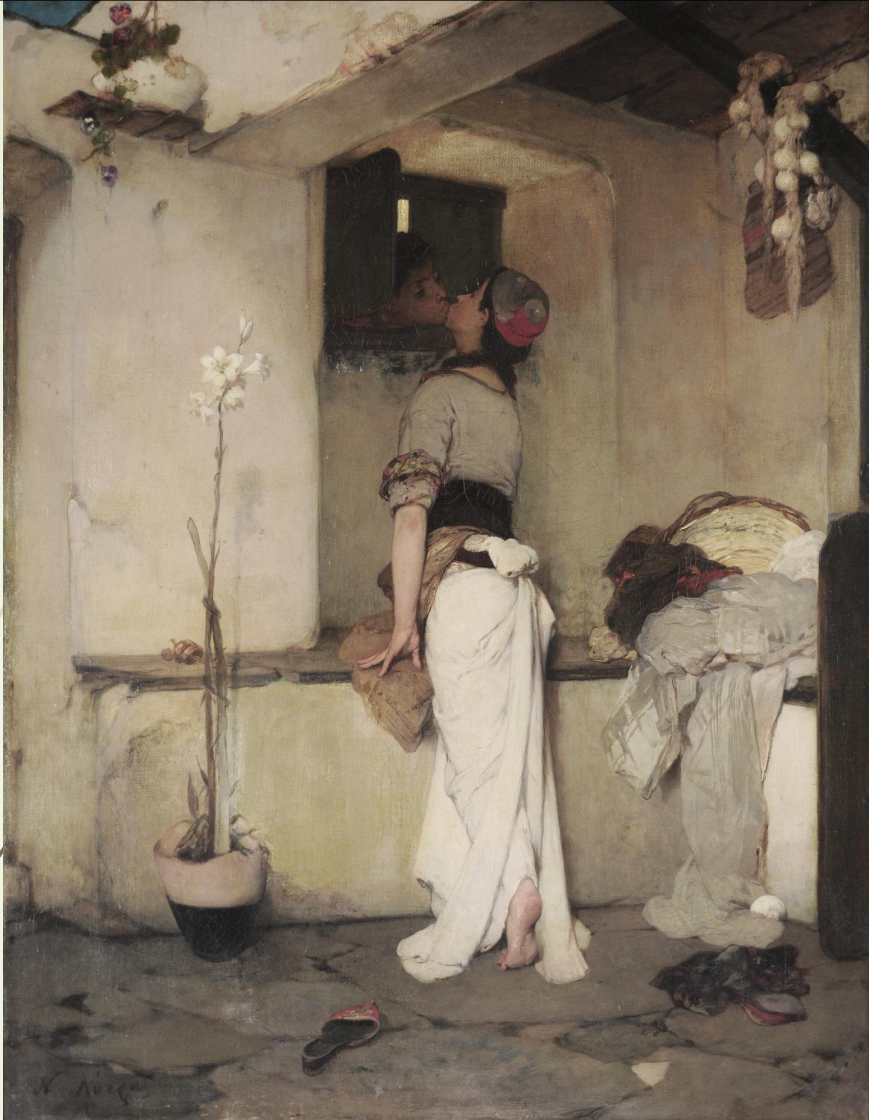
Νικηφόρος Λύτρας (1832-1904), "Το Φίλημα" λάδι σε καμβά, 0,79 x 0,69 μ., Αθήνα, Εθνική Πινακοθήκη.