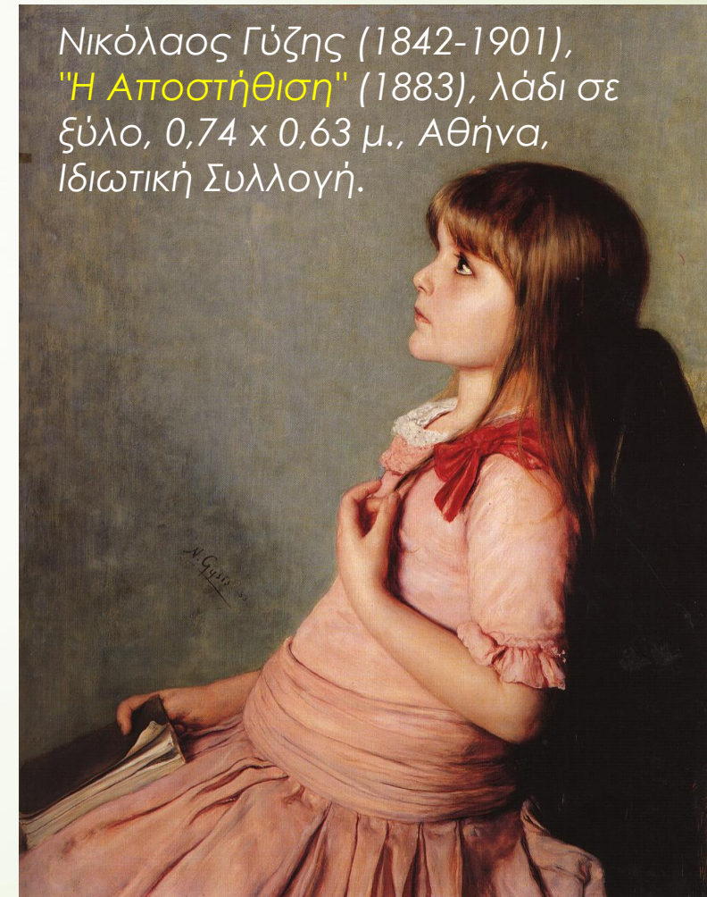
Νικόλαος Γύζης (1842-1901), "Η Αποστήθιση" (1883), λάδι σε ξύλο, 0,74 x 0,63 μ., Αθήνα, Ιδιωτική Συλλογή.