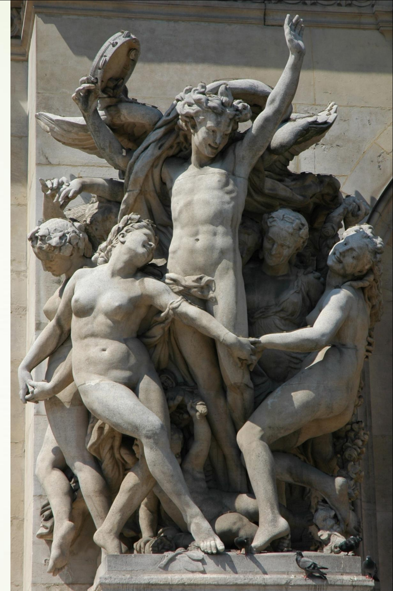
Ζαν Μπατίστ Καρπώ (Jean Baptiste Carpeaux, 1827-1875), "Ο χορός"