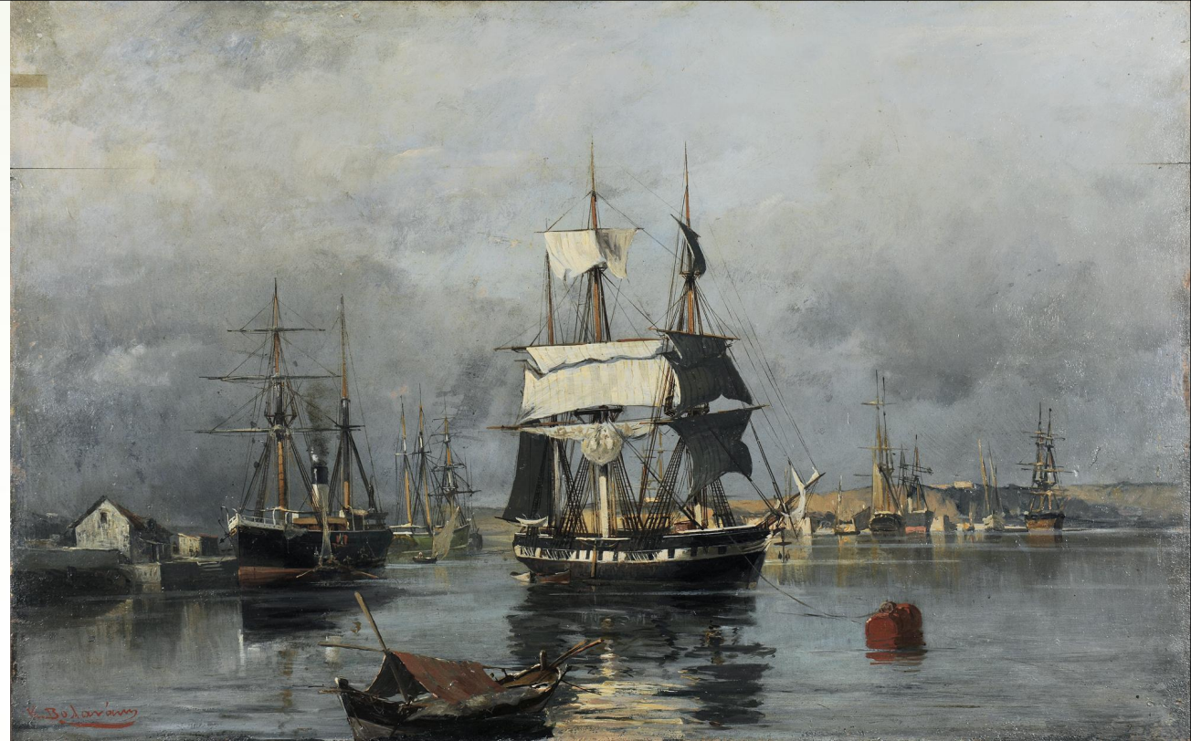
Κωνσταντίνος Βολανάκης (1839 1907), "Η Έξοδος του Άρεως" (1868), λάδι σε καμβά, 1,10 x 1,91μ., Αθήνα, Εθνική Πινακοθήκη.

Η ηθογραφία καταγράφει τα ασήμαντα ή σημαντικά στιγμιότυπα της ζωής τόσο του αστού όσο και του αγρότη, δημιουργεί μια άλλοτε εύθυμη και άλλοτε μελαγχολική ατμόσφαιρα και οπωσδήποτε είναι η ζωγραφική που εξιδανικεύει την ιδιωτική ζωή χωρίς να εκφράζει κοινωνικούς προβληματισμούς ή υπονοούμενα.