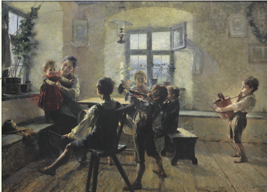
Γεώργιος Ιακωβίδης, "Η παιδική Συναυλία" (1900), λάδι σε μουσαμά, 1,76 x 2,50 μ., Αθήνα, Εθνική Πινακοθήκη.