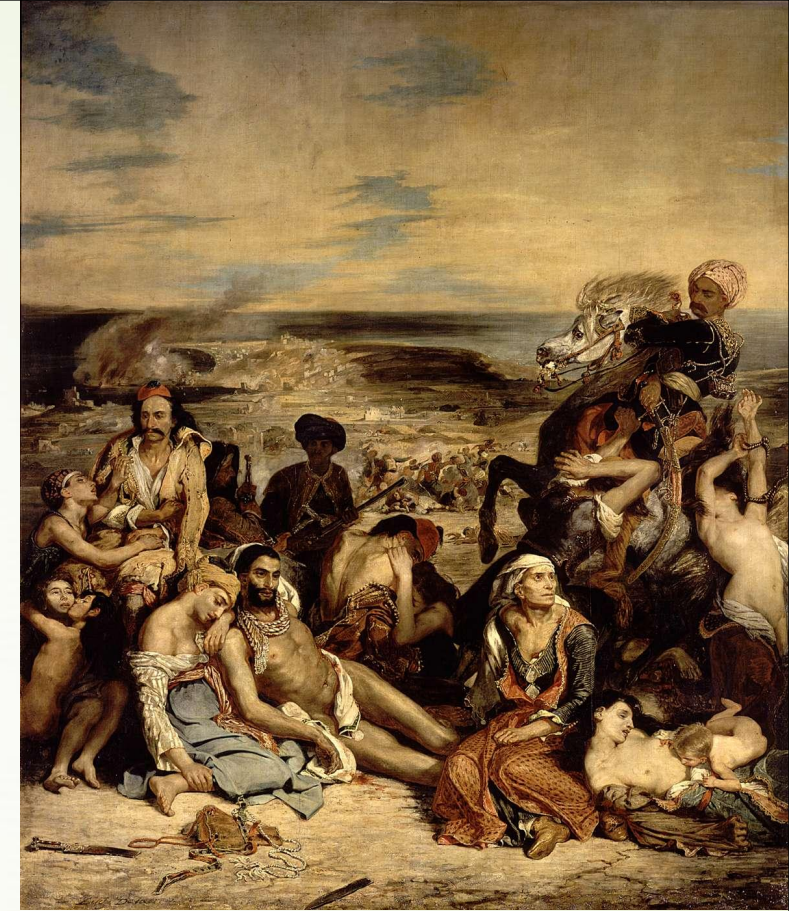
Ε. Ντελακρουά, "Η καταστροφή της Χίου" (1824), 4,22 x 3,52μ., Παρίσι, Λούβρο.

Γουίλιαμ Τέρνερ (William Turner, 1775-1851), "Η παραλία του Καλέ, η άμπωτη και οι ψαράδες που μαζεύουν πεταλίδες"