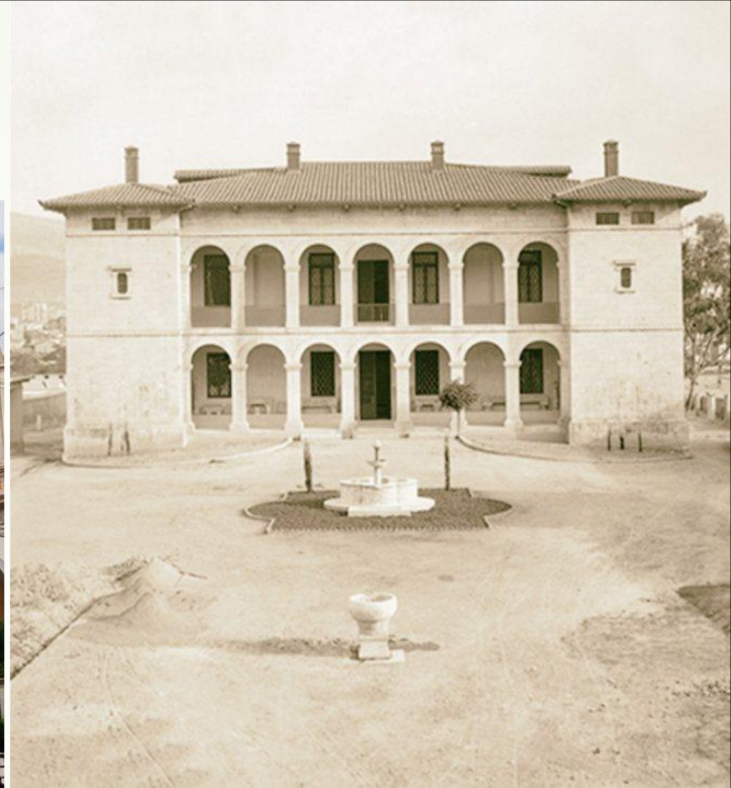
Σταμάτης Κλεάνθης (1802- 1862), Μέγαρο Ιλίσια , σήμερα Βυζαντινό Μουσείο Αθηνών (1840-1848), Αθήνα.