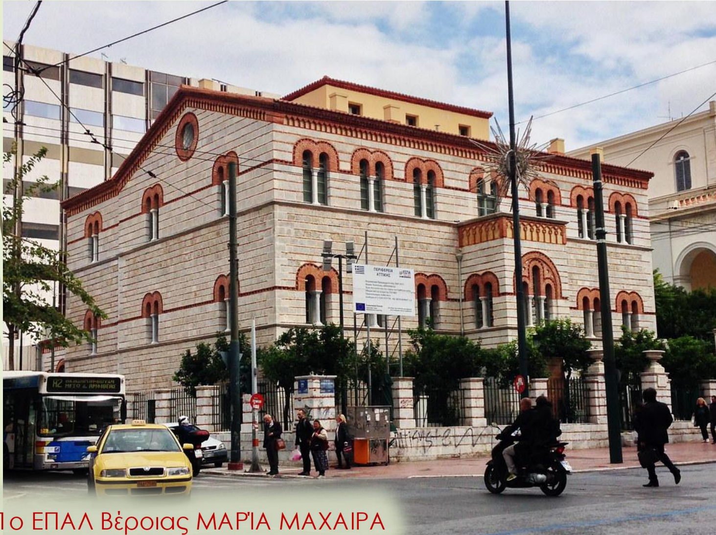
Το ΕΠΑΛ Βέροιας ΜΑΡΙΑ ΜΑΧΑΙΡΑ

Χριστιανός Χάνσεν, Λύσανδρος Καυταντζόγλου, Το Οφθαλμιατρείο (1847), Αθήνα.