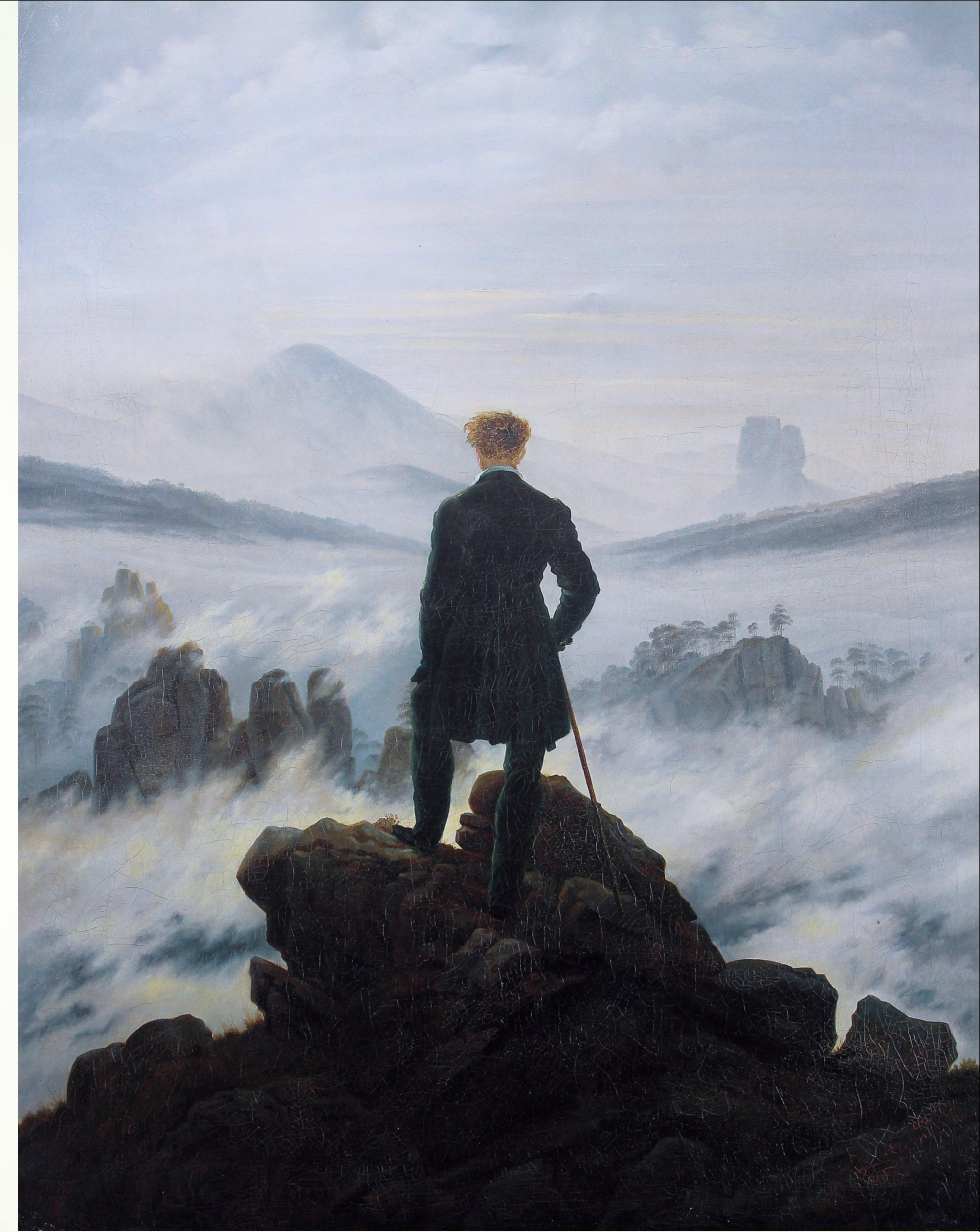
Κάσπαρ Ντάβιντ Φρήντριχ, " Ο μοναχικός περιπατητής στα σύννεφα " (1817-1818), λάδι σε μουσαμά, 0,74 x 0,94 μ., Αμβούργο