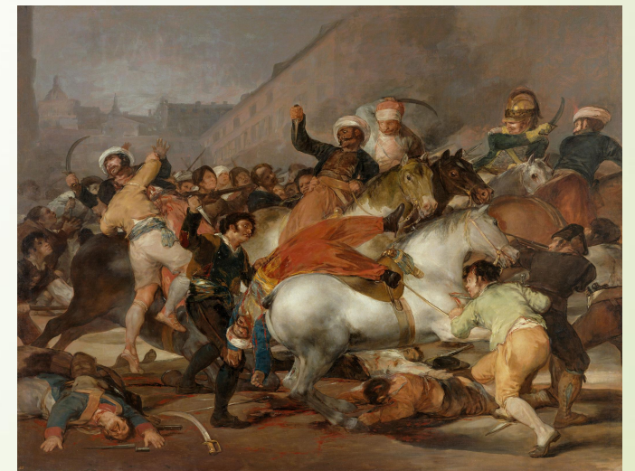
1ο ΕΠΑΛ Βέροιας ΜΑΡΙΑ ΜΑΧΑΙΡΑ