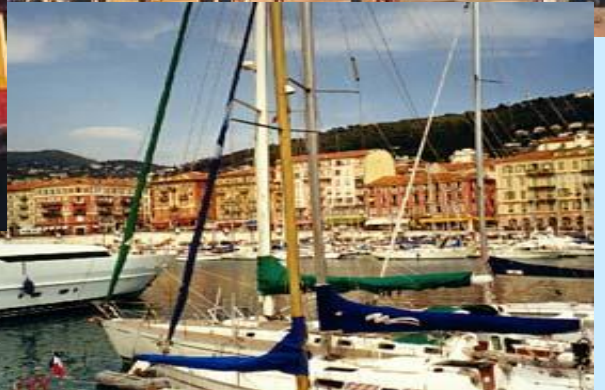
NICE ... EN FRANCE