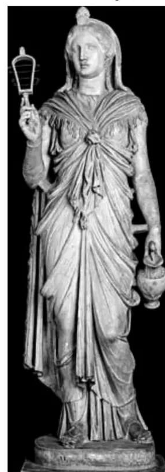
Η ΘΕΑ ΙΣΙΔΑ