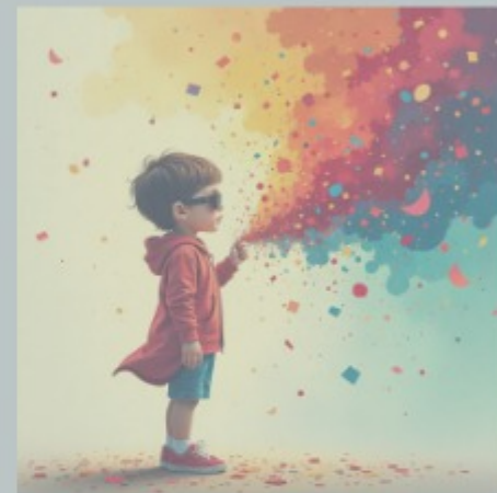
Εικόνα 5 “Παιδί με πρόβλημα όρασης που φαντάζεται χρώματα” (δημιουργημένη με www.freepik.com )

Σκεφτείτε: Μπορούν τέτοιες περιγραφές να μεταφέρουν τα χρώματα σε ανθρώπους που δεν βλέπουν; Εκφράστε την άποψή σας στην ολομέλεια.