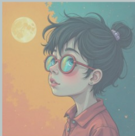
Εικόνα 2 "Παιδί με πρόβλημα όρασης που φαντάζεται χρώματα"

Πώς μπορούμε να εξηγήσουμε τα χρώματα σε έναν άνθρωπο που δεν βλέπει;