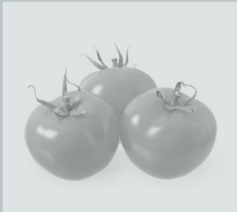
Εικόνα 1 Ντομάτες

Φανταστείτε τα χρώματα που λείπουν στην εικόνα 1. Χρησιμοποιήστε την παλέτα χρωμάτων.